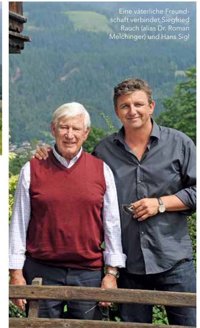
Eine väterliche Freundschaft verbindet Siegfried Rauch (alias Dr. Roman Melchinger) und Hans Sigl

Es hat sich sehr viel verändert! Wenn ich in München in einen Buchladen gehe, mich kurz hinsetze und in ein Buch reinlese, das ich kaufen