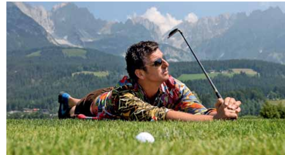
Ob das noch ein Hole-in-one werden kann? Als passionierter Golfer ist Hans Sigl auch auf dem Grün immer für einen Spaß zu haben

Thema Krankheiten und neigt eher dazu zu sagen: „Wie, du blutest? Das wird schon wieder vergehen.“ So Sachen wie die Männergrippe kenne ich auch nicht. Ich leide dann eher meiner Frau zuliebe, damit sie sich Sorgen machen darf. Wir spielen dann damit, dass ich die Männergrippe habe und sie sich um mich kümmert. Aber im Prinzip bin ich nicht wehleidig.