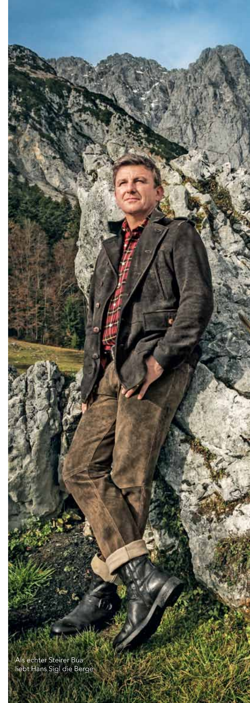
Als echter Steirer Bua liebt Hans Sigl die Berge