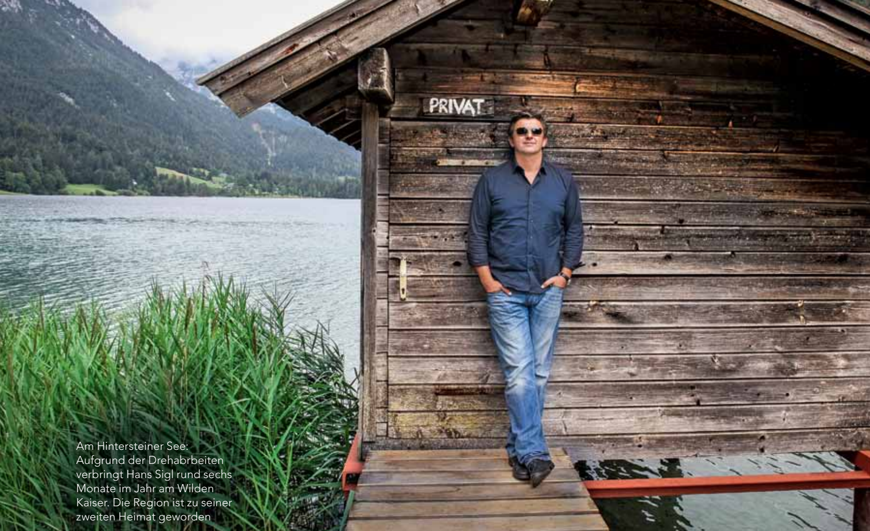
Am Hintersteiner See: Aufgrund der Dreharbeiten verbringt Hans Sigl rund sechs Monate im Jahr am Wilden Kaiser. Die Region ist zu seiner zweiten Heimat geworden