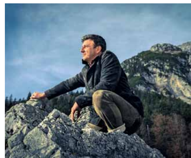
Bergwelt und Frischluft: Diese Kombination darf Hans Sigl während der sechsmonatigen Dreharbeiten genießen

Na klar, es gibt Kinder, die gehen mittlerweile schon in die Schule. Wir sagen immer, dass wir, wenn wir weiterhin so viel drehen, bald den ndF- (Name der Produktionsfirma, d. Red.) Kindergarten gründen müssen. ➔