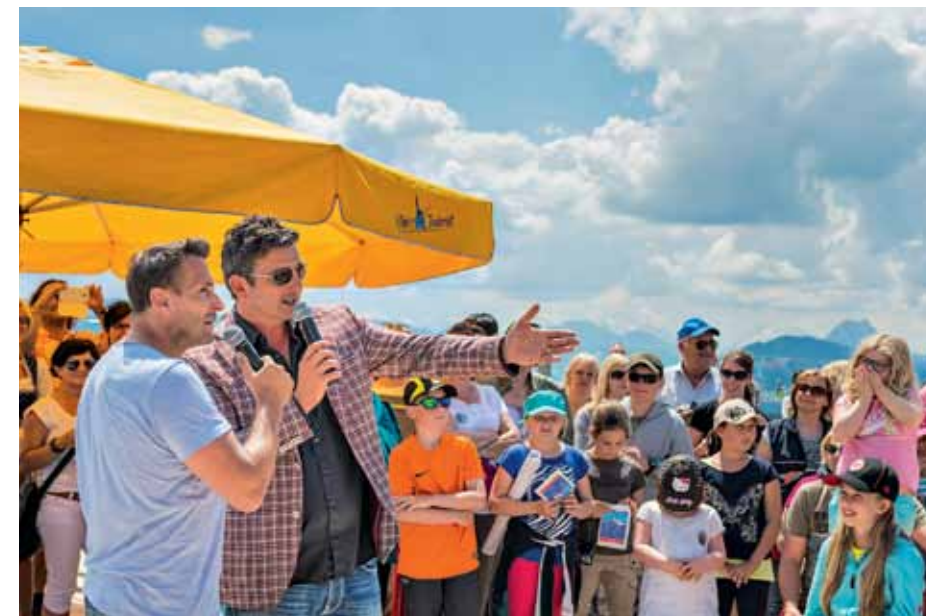
Auf Tuchfühlung mit Hans Sigl und den anderen Schauspielern geht es während der zweimal im Jahr stattfindenden Bergdoktor-Fanwochen in Ellmau und Umgebung