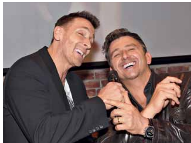
Zwei, die sich gefunden haben: Mit Mark Keller verbindet Hans Sigl eine enge Freundschaft, die weit über ihre Rolle vor der Kamera hinaus geht